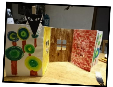
Tableau 2, 3 et 4 : Les différentes maisons des Trois petits cochons

Tableau 1 et 5 : La forêt, lieu de mise en situation du conte