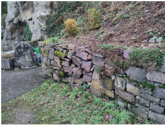
Schönberg – Avant Travaux