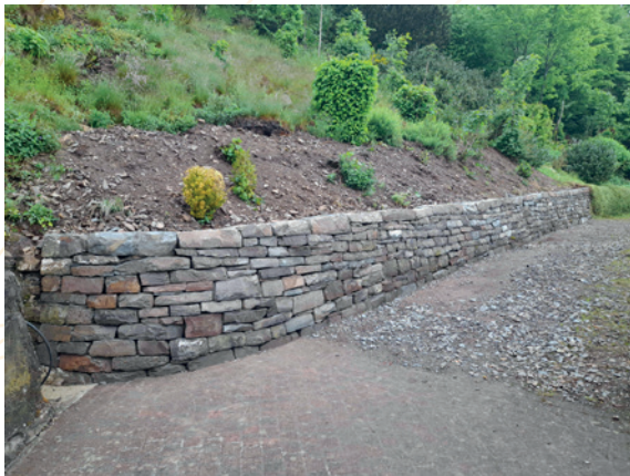
Schönberg – Après Travaux