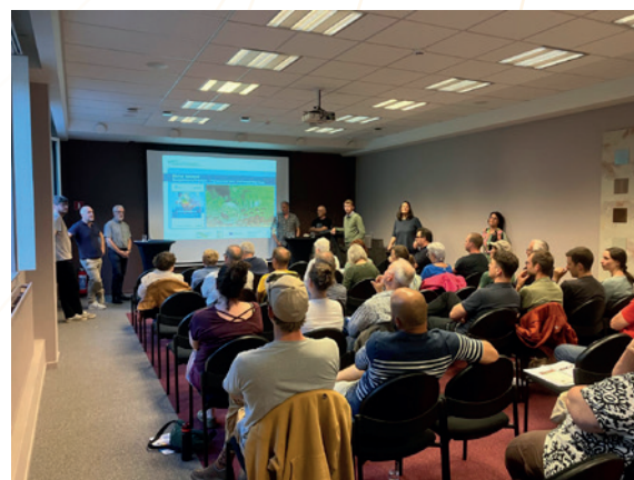
Soirée d'information – Végétalisation Bâti – Table ronde