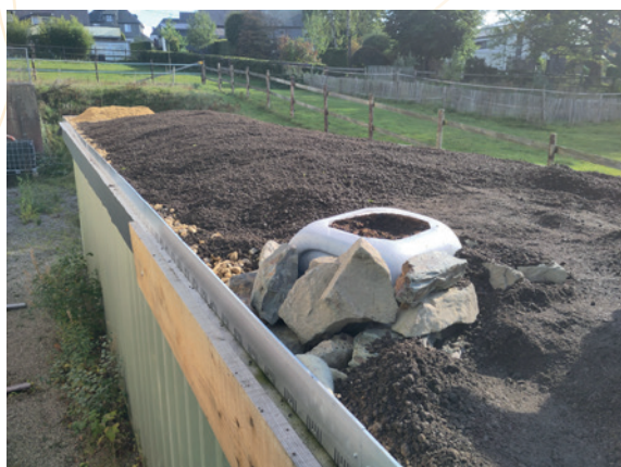
Toit Vert BIB – Substrats divers