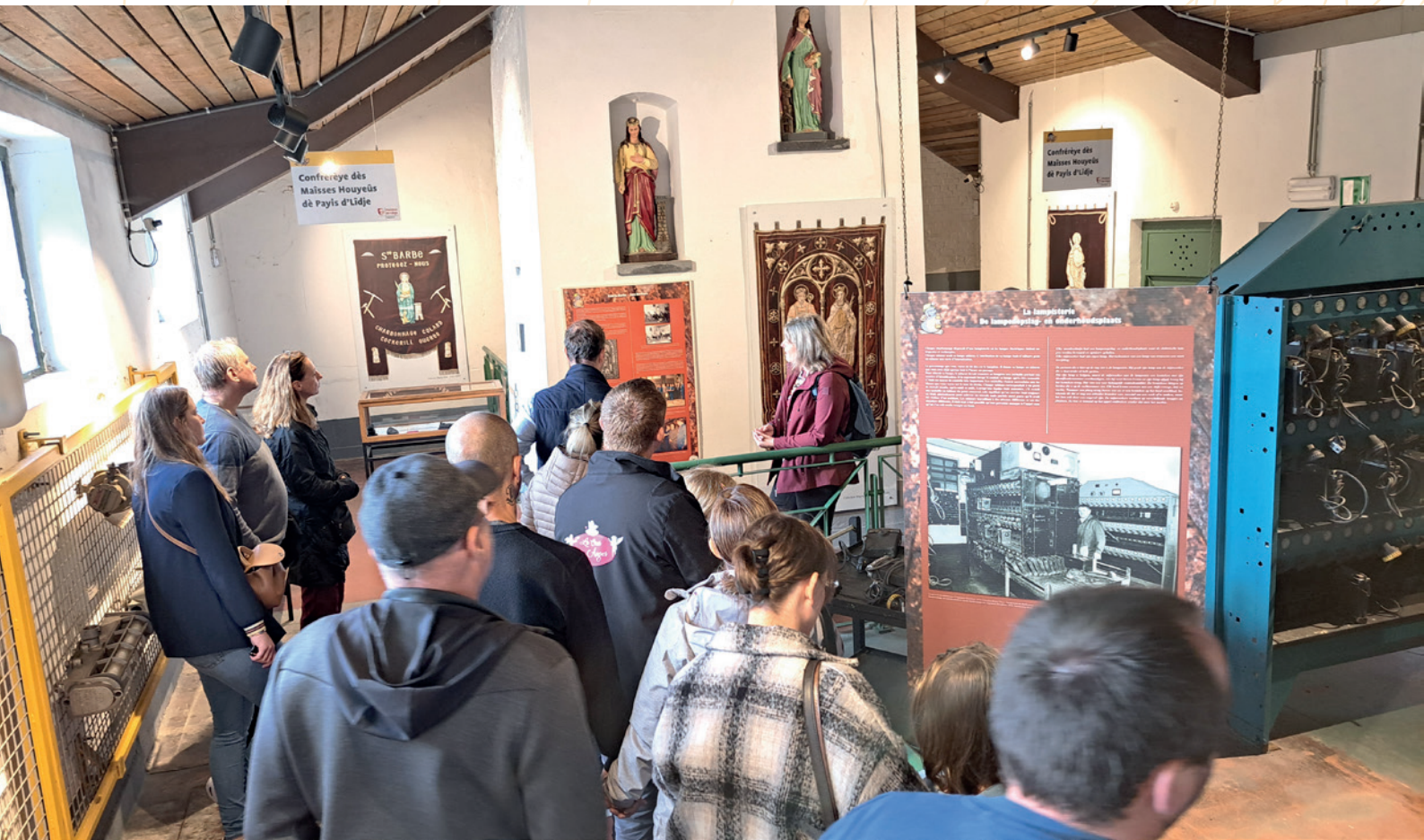
Journées du patrimoine