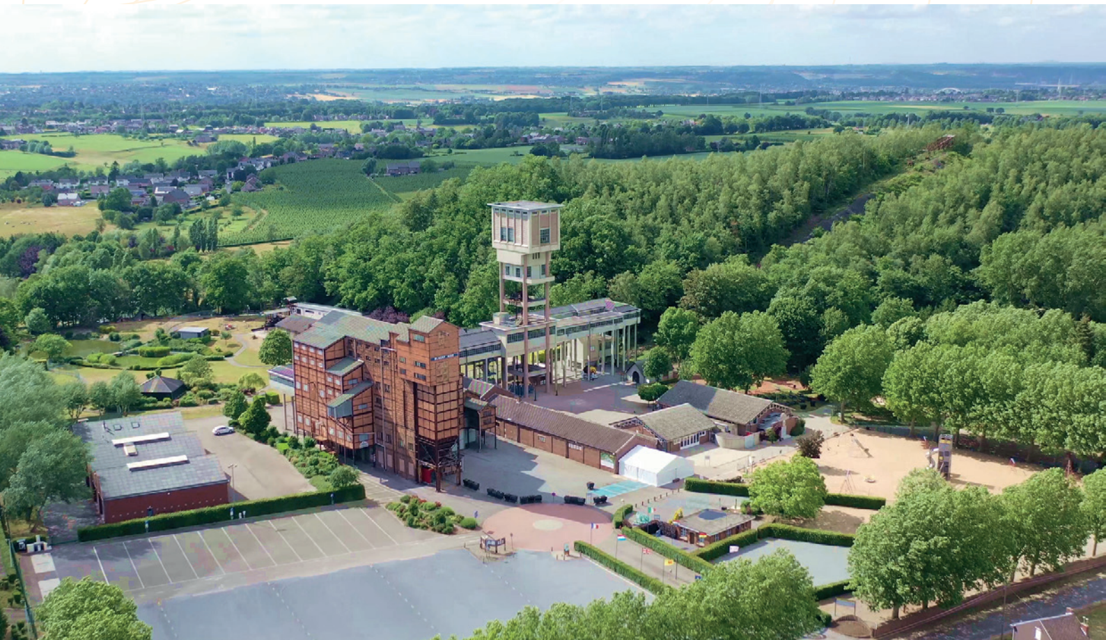
Blegny-Mine – Pays de Herve – 2020