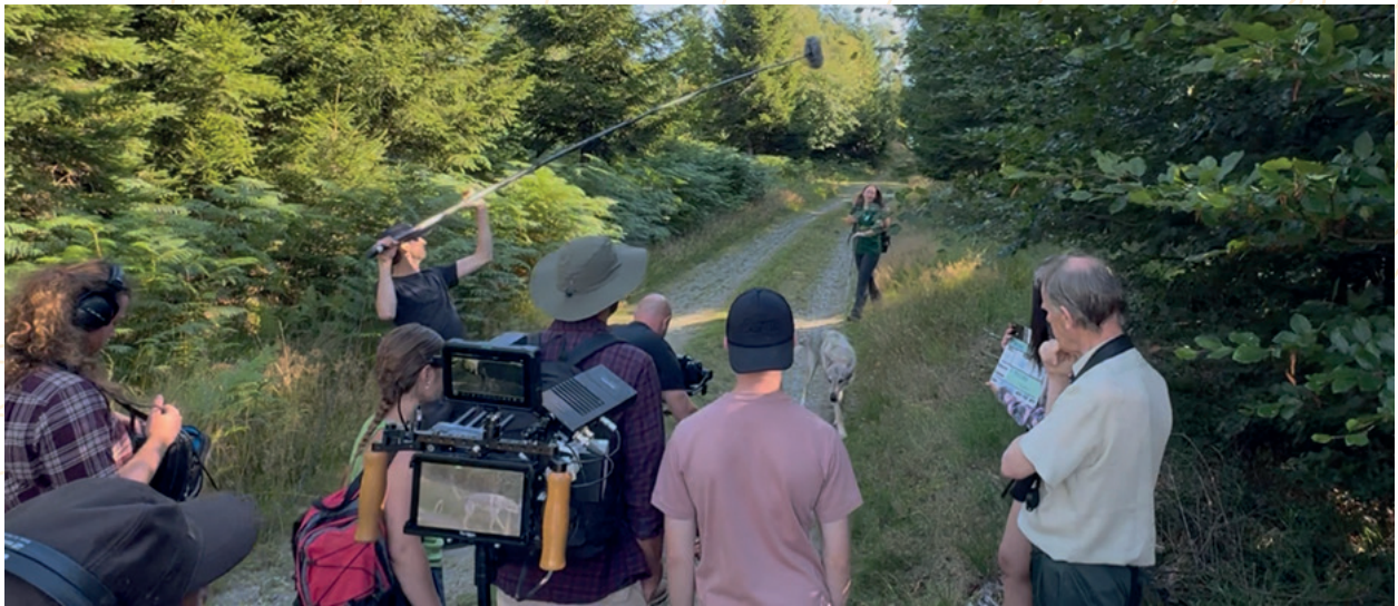
Tournage film pédagogique