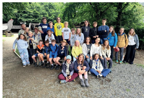
Camp de jeunesse transfrontalier

Du 16 au 20 juillet 2025, le Parc naturel Hautes Fagnes-Eifel (PNHE) a organisé, dans le cadre du volet « Éducation et sensibilisation » de son plan de gestion, un camp de jeunesse transfrontalier. Vingt-trois jeunes (1013 ans) d'Allemagne et de Belgique, hébergés à BurgReuland, ont participé à des ateliers visant à développer des projets concrets de protection de la nature. Le camp, gratuit pour tous grâce au soutien de sept Rotary Clubs et du « Bürgerfonds Ostbelgien », a été encadré par six animateurs bénévoles et soutenu par plusieurs partenaires, dont le « Jugendinfo Eupen » pour l'atelier « Gestion de projets ». Une évaluation a été réalisée auprès des participants et des animateurs.