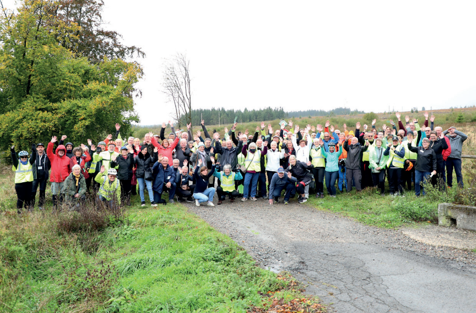
Journée des Vérificateurs et Vérificatrices bénévoles à la Maison du Parc – Botrange

le RAVeL à Sart-Jalhay ( \pm 5 km). Le balisage du réseau existant a par ailleurs été adapté en certains endroits, de sorte à intégrer de nouvelles infrastructures dont le SPW ou les communes sont à l'initiative.