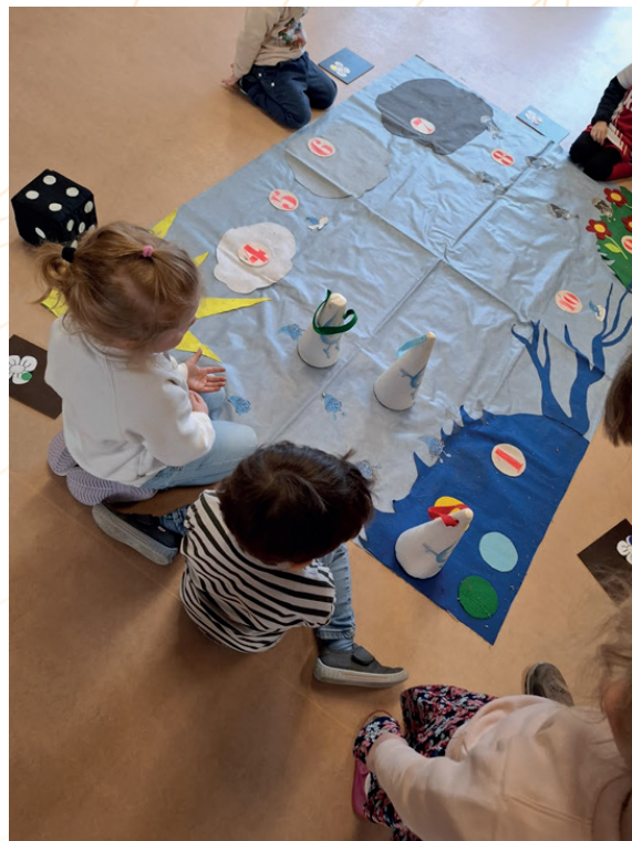
Animation Journées Wallonnes de l'eau

L'appel à participer au projet en 2025-2026 a été lancé auprès des écoles début juin 2025 auprès des écoles du bassin de l'Our. Quatre écoles sont inscrites pour l'année scolaire en cours. Dans le cadre de ce cinquième cycle, deux premières animations ont eu lieu dans deux classes différentes en décembre 2025.