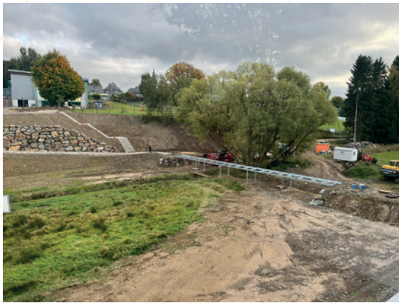
Osterbach – Passerelle

Les actions prévues visent notamment le renforcement du maillage écologique, la mise en œuvre de mesures pilotes de redynamisation du cours d'eau, la création de mares et d'un cordon rivulaire, la conversion progressive des versants en forêt mélangée étagée, ainsi que la plantation d'une lisière agroforestière, d'un cordon arbustif et d'une haie vive. Un verger haute tige est également programmé, de même que l'installation d'une toiture végétalisée sur un conteneur de l'école.