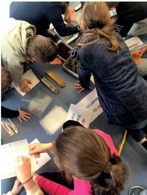
Projet aquarium – animation en classe