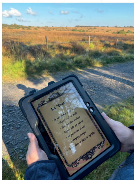
Test Explor Games – La route maudite