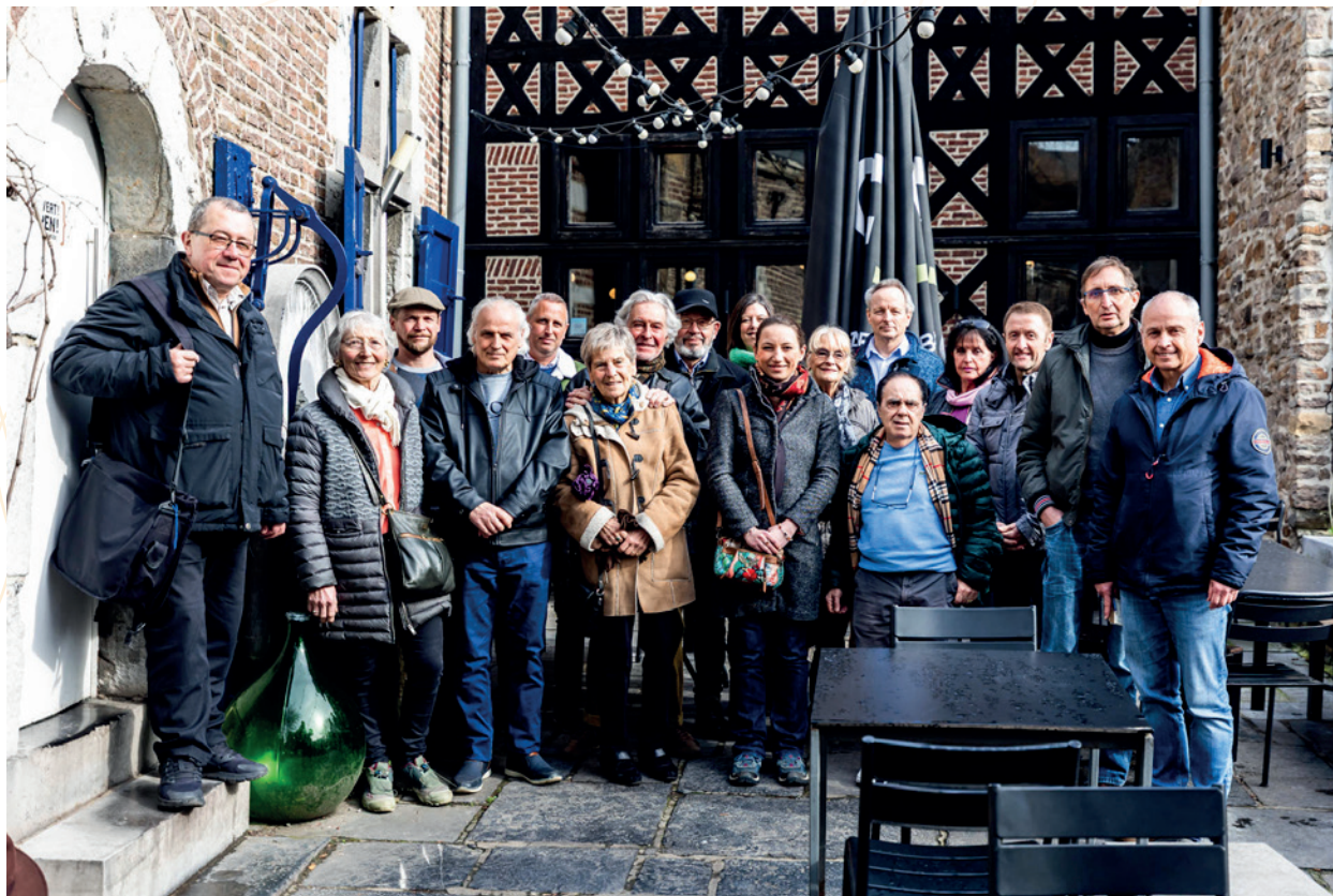
Réunion annuelle des guides