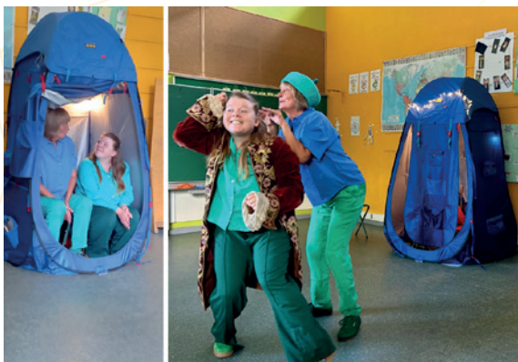
Pièce de théâtre en classe

Le tournage du film pédagogique a eu lieu du 17 au 19 août 2025 sur le plateau des Hautes Fagnes.