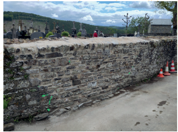
Weweler – Formation pratique – Partie de mur finalisé