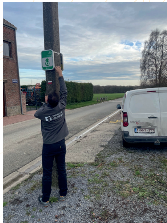
Travail d'entretien du réseau points-nœuds cyclable