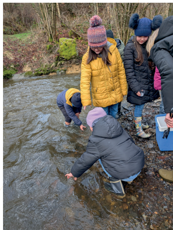
Projet aquarium – relâcher les alevins

Au total, trois animatrices se sont rendues dans 6 classes différentes, sensibilisant 96 élèves.