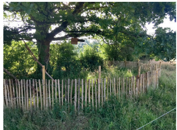
Stertert – Abris – Chevêche