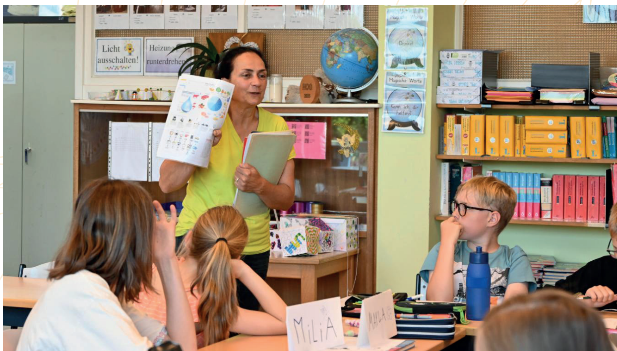
Projet Leader – Animation Ressource eau – gaspillage zéro

adopter au quotidien. Toutes les écoles primaires du GAL « 100 Villages, 1 Avenir » ont été contactées afin de leur proposer de participer au projet.