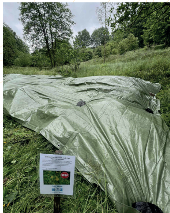
Gestion du mimule tacheté par bâchage

Le site de l'ancienne gare d'Honsfeld appartient actuellement à la SNCB qui a lancé un marché public dans le cadre d'une concession domaniale. La coopérative courant d'Air, une représentante de la CLDR de Bullange ainsi que le parc naturel se sont regroupées afin de proposer un projet illustrant pleinement la possibilité de concilier transition énergétique, préservation de la biodiversité, attractivité touristique et retombées positives pour la collectivité locale. Sa conception rigoureuse, fondée sur des concertations citoyennes et institutionnelles, des inventaires écologiques et des études techniques poussées, en fait un projet exemplaire de sérieux et de collaboration. Ce projet incarne un modèle de développement durable, où chaque dimension est prise en compte et valorisée. Grâce à ce projet, le site de l'ancienne gare d'Honsfeld