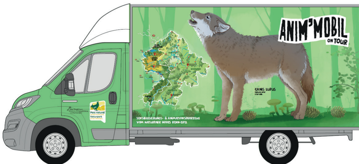
Graphisme véhicule de sensibilisation