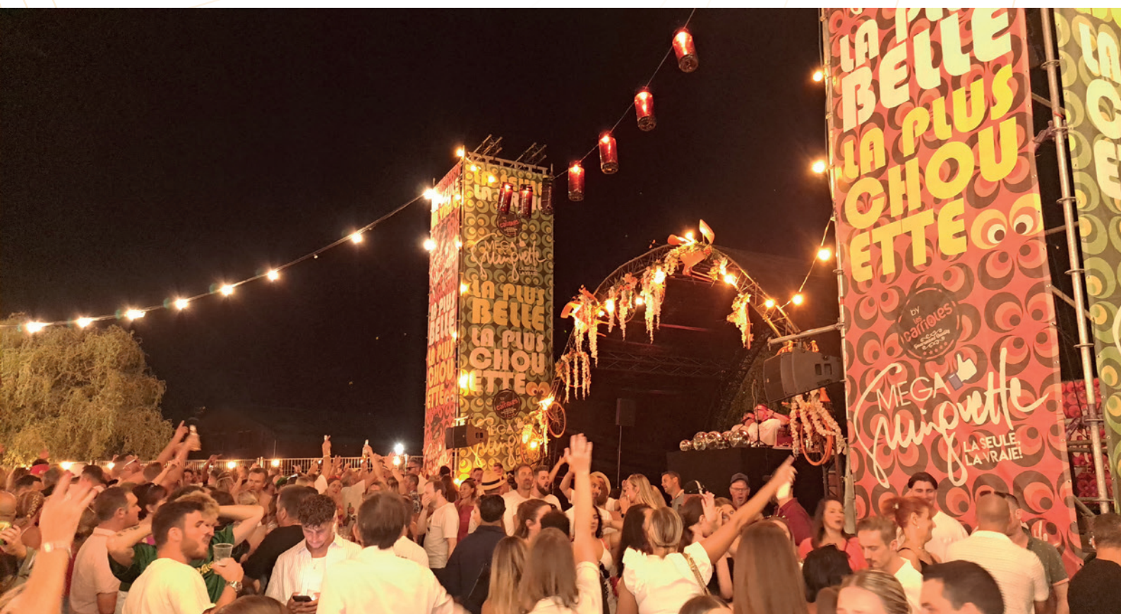
Mega Guinguette