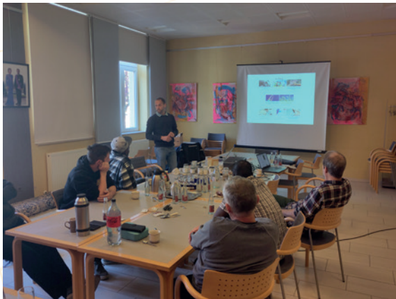
Weweler – Formation théorique

le plan écologique, la remise en état d'un mur ancien contribue à recréer un habitat structuré favorable à un large continuum d'espèces typiques des milieux rocheux.