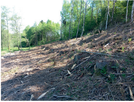
Osterbach – Déboisements BIB