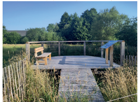
Stertert – Plateforme