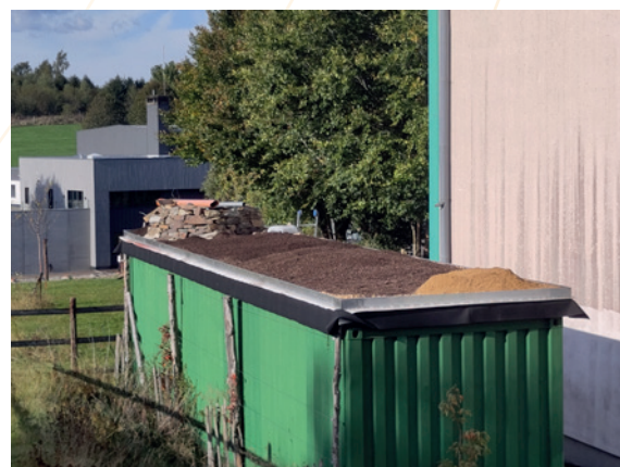
Toit Vert BIB – Après travaux