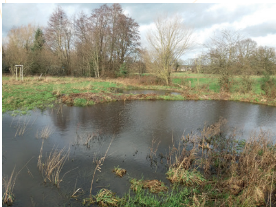
Stertert – Mares