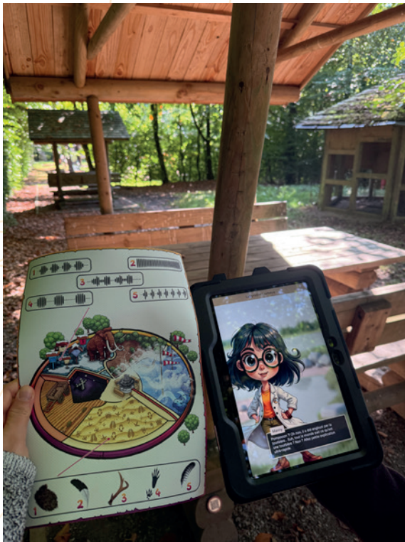
Test Explor Games – Panique à Fania Parc