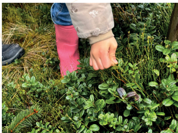
Animations – Maison du Parc

51 journées d'animation (95 groupes pour un total de 1.866 élèves)