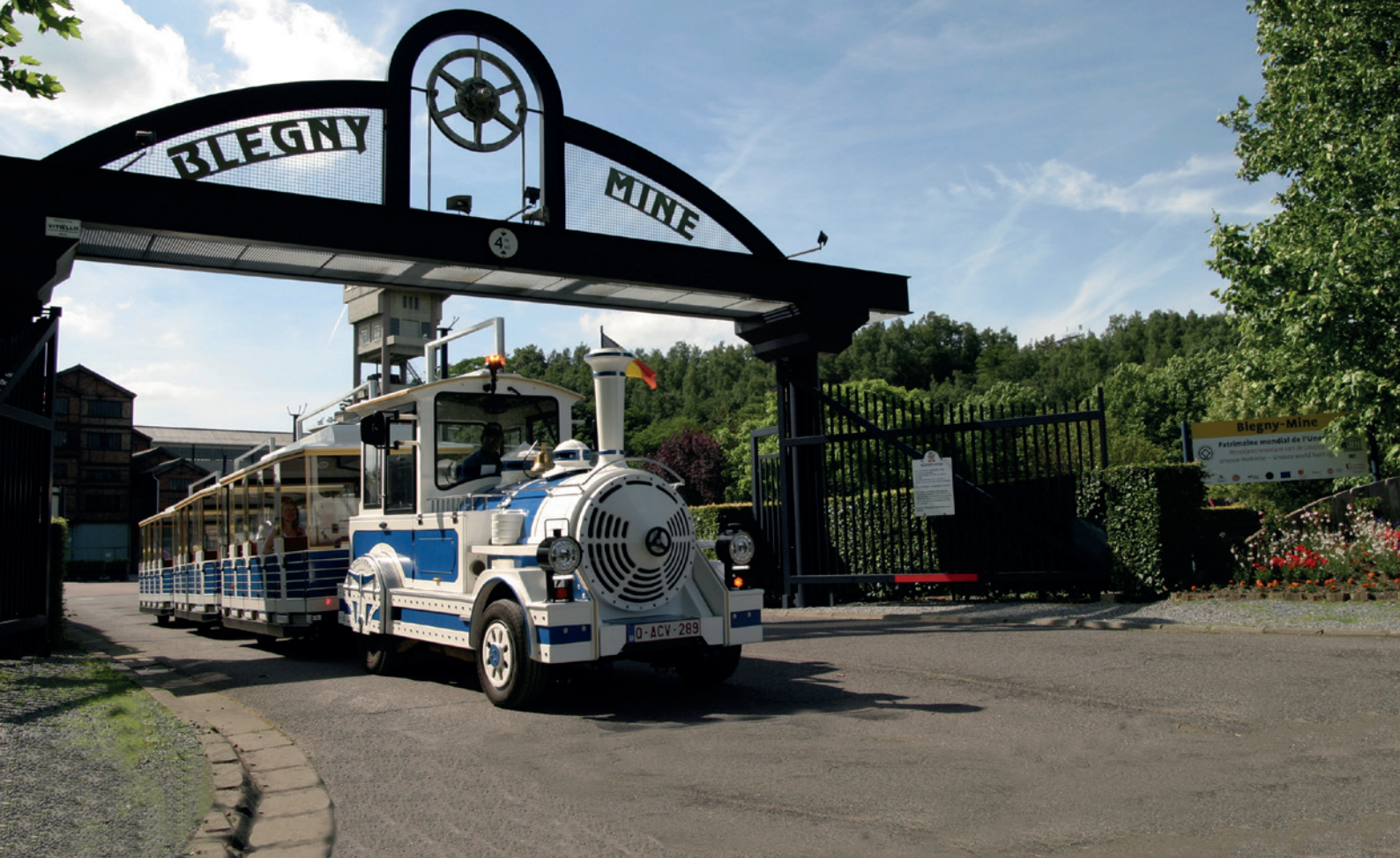
Blegny-Mine et train