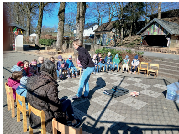
Animation Journées Wallonnes de l'eau

En 2025, 5 journées d'animation ont été organisées pour les classes maternelles de dix écoles du Bassin de l'Our dans le cadre des Journées Wallonnes de l'Eau. En tout, 140 élèves ont été sensibilisés sur la thématique de l'eau lors de 10 demi-journées d'animation dans 10 classes différentes, de la première à la troisième maternelle.