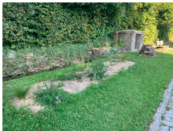
Fleurissement durable – Jalhay

Le travail a débuté en 2024 par la sélection des sites et l'élaboration des plans de plantation, en collaboration avec Adalia, dans une optique de fleurissement durable. Les plantations ont été exécutées au printemps 2025. Quatre bacs en acier corten, conçus sur mesure, ont également été installés sur l'un des sites.