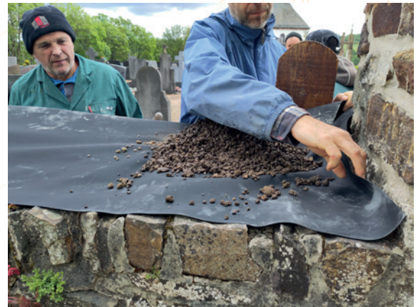
Weweler – Formation pratique – Couvre mur végétal