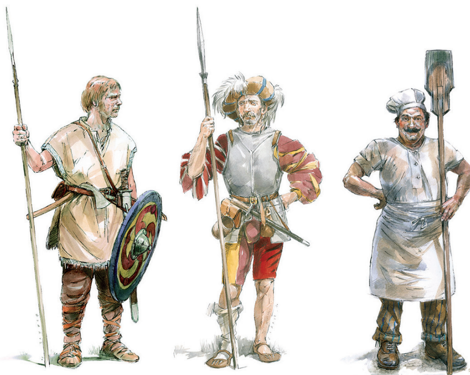
Nouvelle identité visuelle des Musées de Logne

La volonté de l'ASBL est de développer un pôle muséal « Les Musées de Logne », composé des 3 musées : le Musée du Château fort de Logne, le Musée mérovingien et le Musée de la boulangerie. Une nouvelle identité visuelle a été développée tant sur la signalétique de la ferme de la Bouverie que dans les visuels promotionnels.