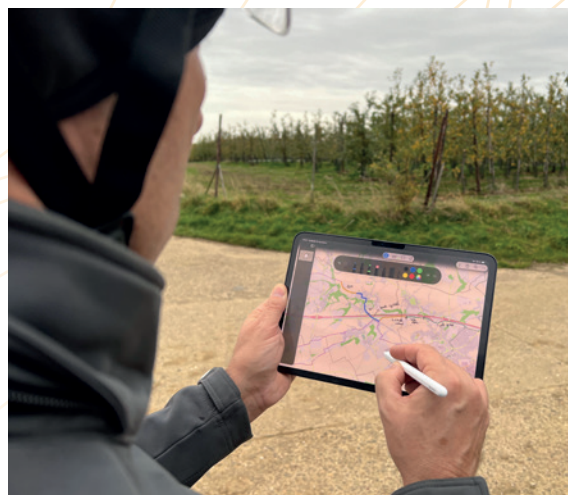
Travail de repérage de terrain en vue des extensions du réseau points-nœuds cyclable

La différence entre les notifications globales et le traitement y réservé tient aux doublons ou aux signalements trop légers pour une intervention.