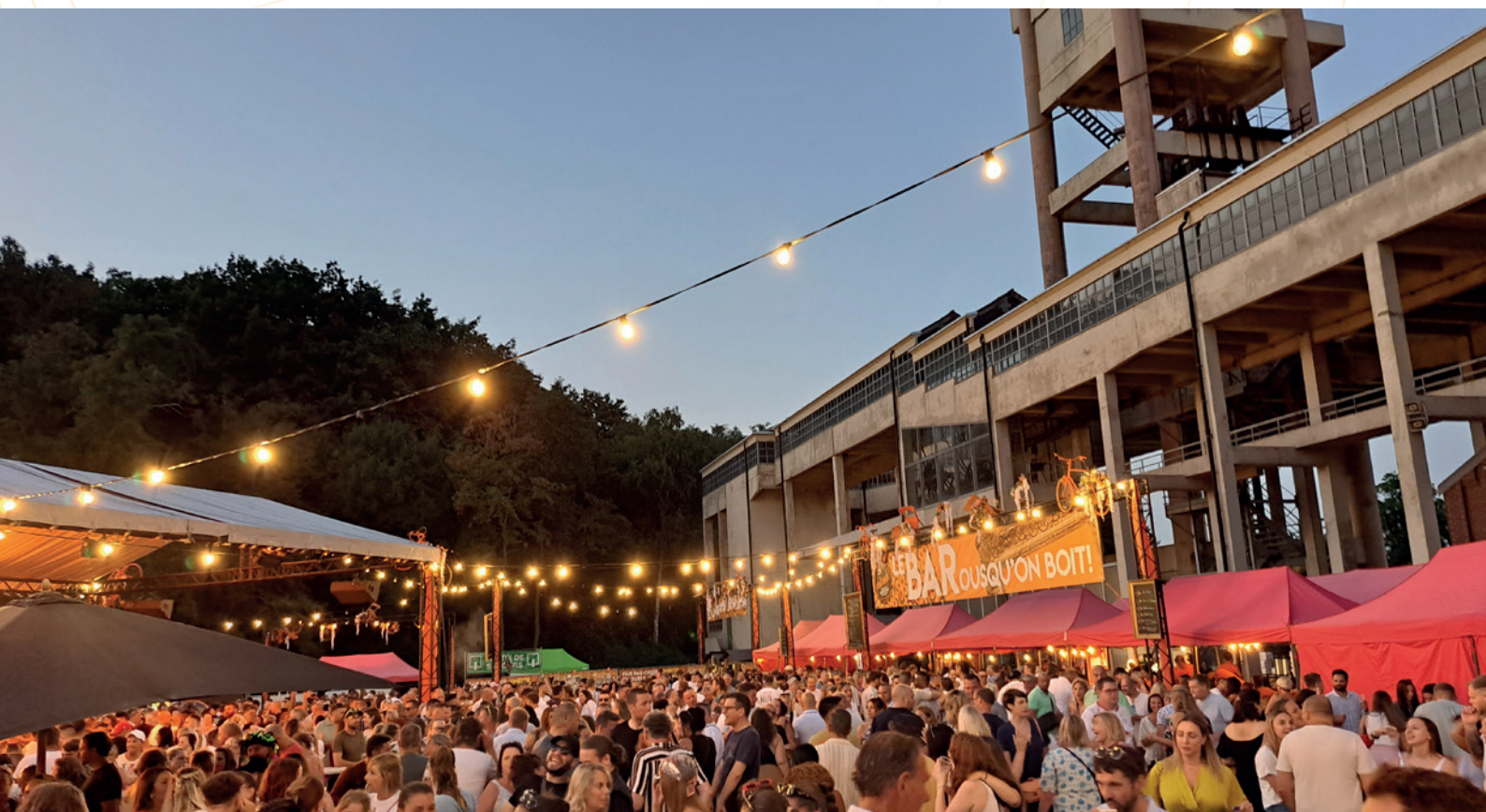
Mega Guinguette