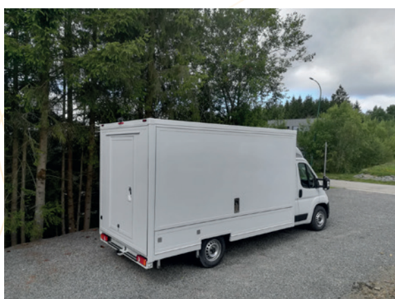
Véhicule de sensibilisation

Les deux parcours Explor Games ont été testés en octobre 2025 sur le terrain, à la Maison du Parc-Boترange. Après une dernière phase de correction, ils sont à présent en cours de traduction dans les trois autres langues prévues par le marché (doublage en DE et NL + version sous-titrée EN).