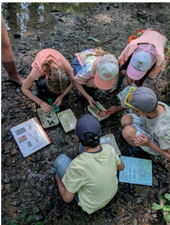
Projet Leader – Animation agriculture et eau

pour être utilisée aussi bien lors des animations scolaires menées dans le cadre du projet Leader que lors de sorties autonomes, cette mallette sera également disponible en allemand.