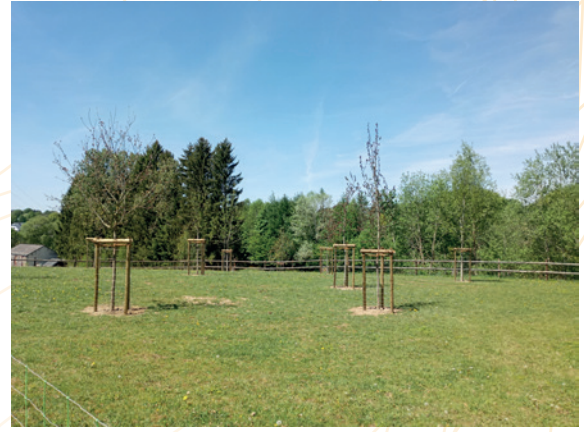
Osterbach – Verger BIB