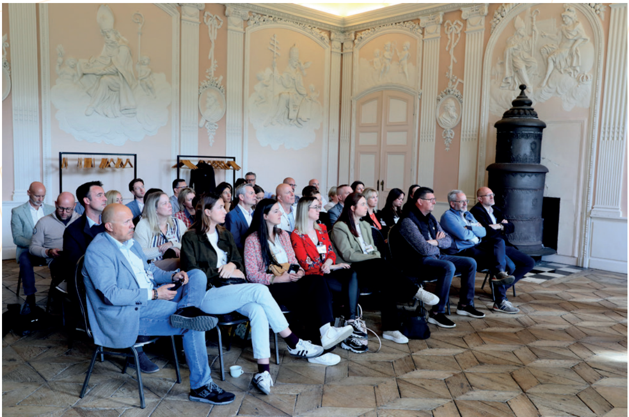
Assemblée Générale du Club MICE

Tous les membres du bureau sont arrivés à la fin de leur mandat de 2 ans. Une nouvelle élection aura donc lieu lors de l'Assemblée Générale du Club MICE qui se tiendra le 03 février 2026.