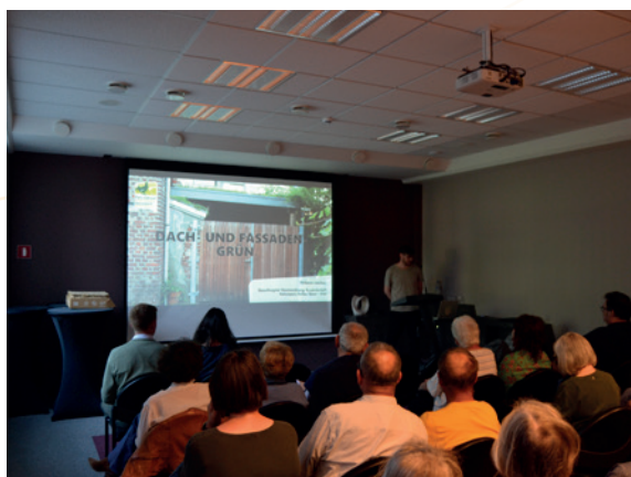
Soirée d'information – Végétalisation Bâti – PPT Parc naturel

Ce moment a également marqué le lancement officiel du concours « Verdissement du bâti », destiné aux associations, initiatives citoyennes et établissements scolaires des communes de Raeren, Eupen, Lontzen et Kelmis. Les projets retenus bénéficient d'un soutien financier pouvant atteindre 2.500 € ainsi que d'un accompagnement professionnel assuré par le Parc naturel Hohes Venn-Eifel. L'appel à candidatures, clôturé le 15 octobre 2025, a permis de recueillir cinq dossiers – trois écoles, une initiative de quartier et un groupe villageois – majoritairement orientés vers la végétalisation de façades, ainsi qu'un projet de toiture. L'ensemble des candidats recevra un appui technique et financier pour concrétiser leur initiative.