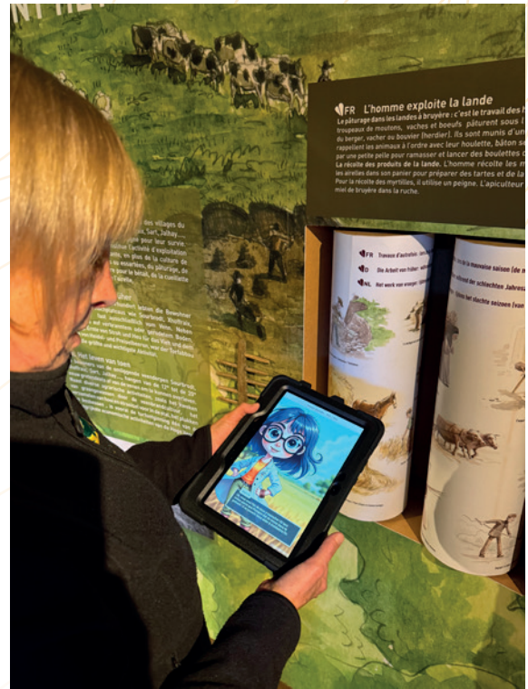
Test Explor Games – Panique à Fania Parc

Un avenant pour l'extension du marché initial a été conclu en octobre 2025 en vue de réaliser deux teasers vidéo pour ces Explor Games, déclinés en quatre langues (français, néerlandais, allemand, anglais). L'ensemble sera livré début 2026.