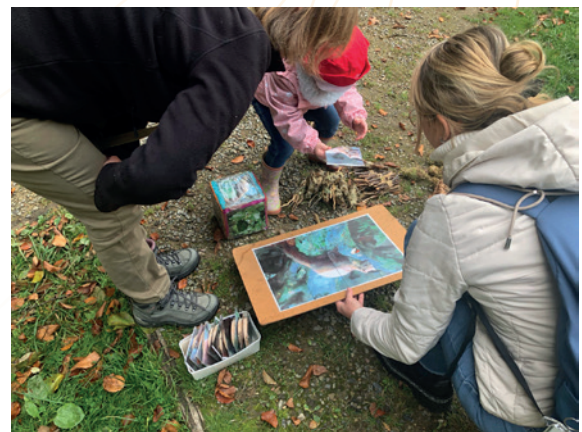
Action 9.7 – Animations maternelles

Le courrier de promotion de la nouvelle offre d'animation pour les maternelles a été envoyé fin août 2025 aux écoles. Sept écoles ont réservé une animation (pour un total de 23 groupes) pour ce groupe cible entre octobre 2025 et juin 2026 suite à la réception de ce courrier.