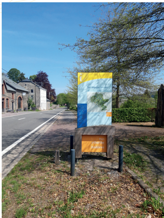
Un panneau Relais Information Service du schéma de Signalisation touristique provinciale

La FTPL a réitéré auprès de la ministre wallonne en charge du Tourisme, une demande de dérogation relative au maintien pendant 15 ans de la signalisation touristique provinciale finalisée en 2016. La position de la FTPL, discutée et approuvée par les sept Maisons du Tourisme (attente de la position officielle d'Aqualis) est de maîtriser l'investissement qui serait lié à la mise à jour de cette signalisation ; en d'autres termes, il s'agit d'éviter un investissement qui serait disproportionné au regard de la valeur ajoutée réelle de ce type de signalisation, rendue obsolète par l'usage généralisé de la numérisation des données et de la téléphonie mobile. En novembre 2025, le Gouvernement wallon a approuvé cette demande et octroyé à la FTPL la dérogation demandée, l'autorisant à procéder au retrait de ladite signalisation touristique.