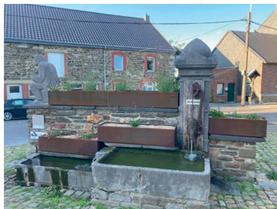
Fleurissement durable – Jalhay

En complément, des aménagements dédiés à la petite faune ont été installés : nichoirs, gîtes à chauves-souris et abris à reptiles. La porte d'un des puits a par ailleurs été remplacée afin de permettre son utilisation comme site d'hibernation pour les chauves-souris.